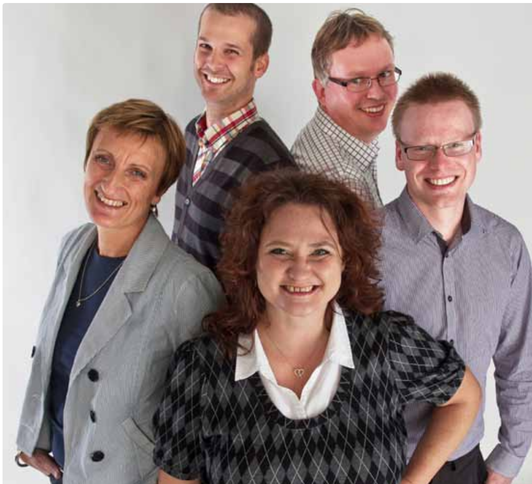
Fler glada sogeti-are – Snart öppnar vi vårt 22:a kontor i Borås med fler passionerade IT-konsulter